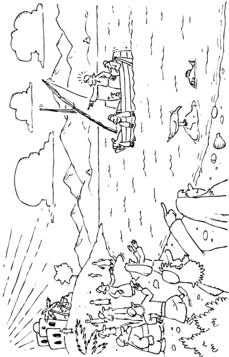
Ausmalbild zum 16. Sonntag im Jahreskreis B / Mk 6, 30-34